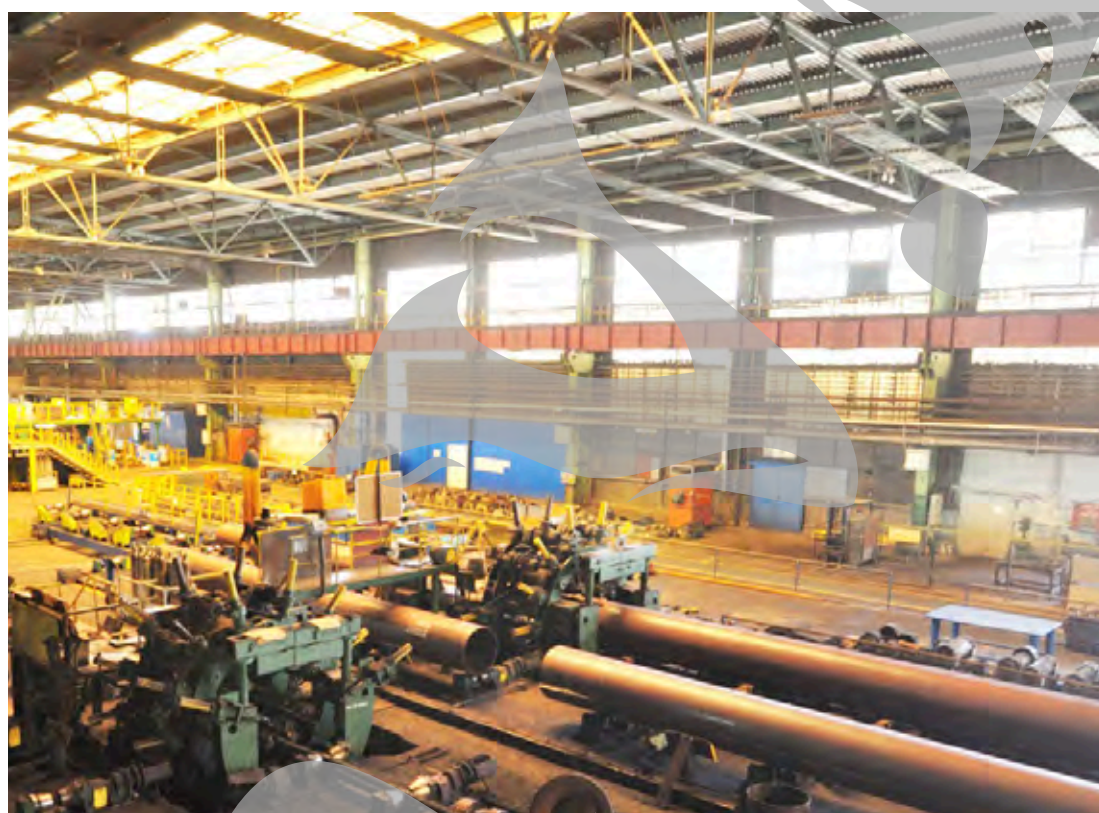
Numărul angajaților a crescut ușor anul trecut

din ultima vreme arată că lucrurile au căpătat o nuanță ceva mai vioaie. Potrivit datelor oficiale de pe site-ul Ministerului Finanțelor, ArcelorMittal Tubular Products Galați a făcut în 2012 profit după trei ani consecutivi în care a înregistrat pierderi. În 2012, profitul brut a fost de 33 de milioane de lei, la o cifră de afaceri de aproape 128 de milioane de lei, cifre care i-au și adus companiei primul loc în clasamentul celor mai bune întreprinderi mijlocii din Galați. În 2011, 2010 și 2009, anii în care criza s-a resimțit cel mai puternic, compania a înre-