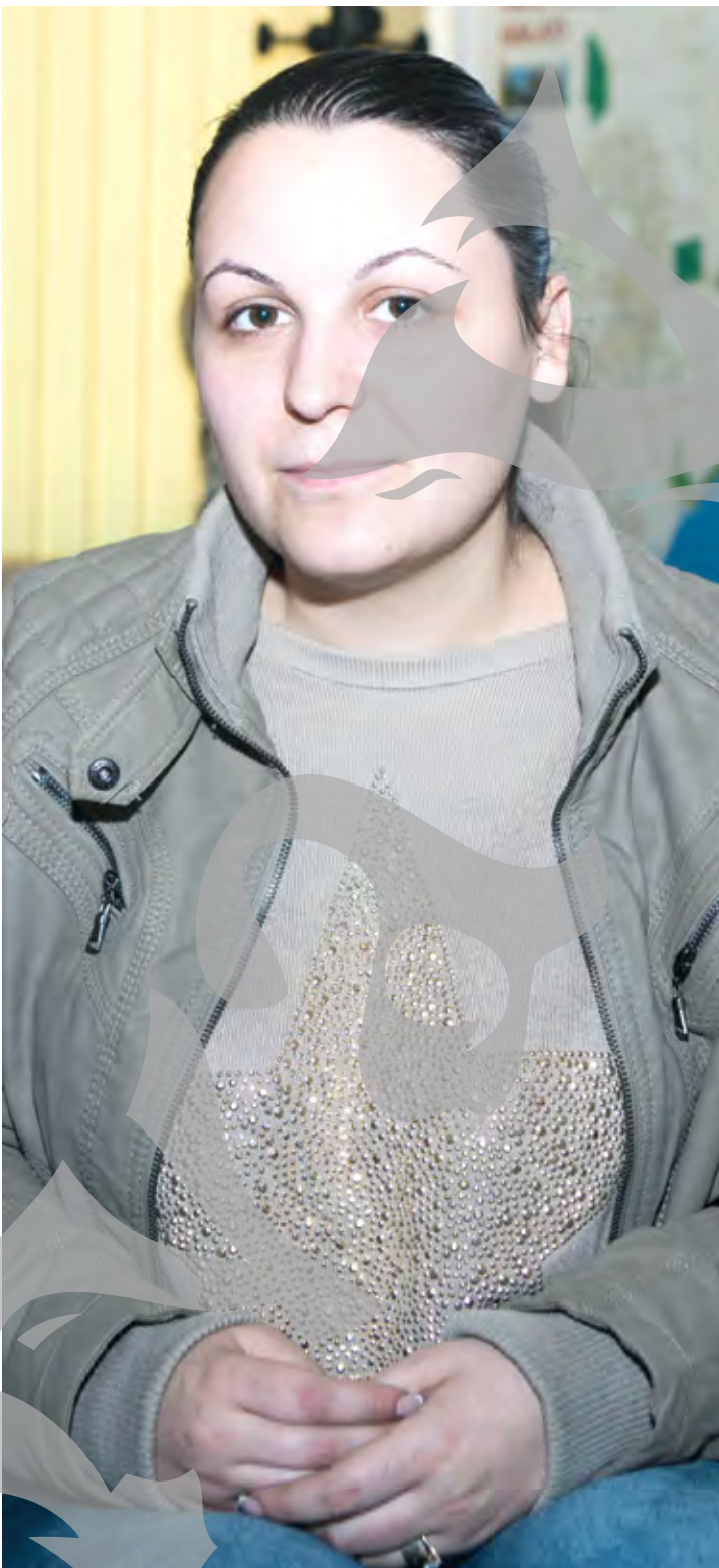
Sesizare inedită la ITM