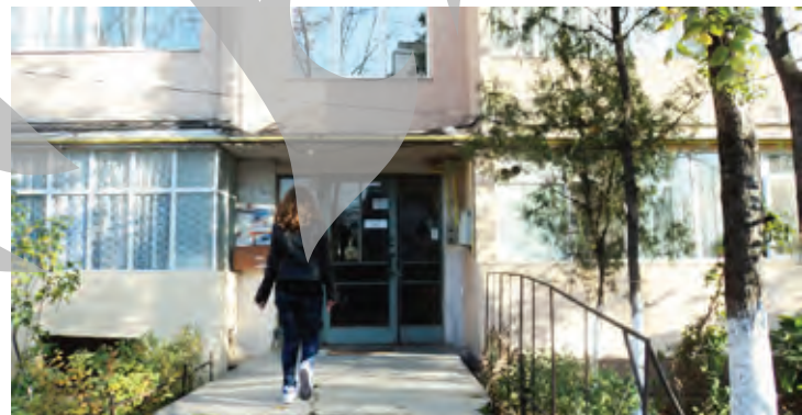
Bărbatul locuiește în Țiglina III, în apropiere de Complex Siret

Are 40-45 de ani și locuiește singur în apartamentul de două camere din Țiglina III. Deși e slab ca un ogar, pare că nu-i lipsește puterea