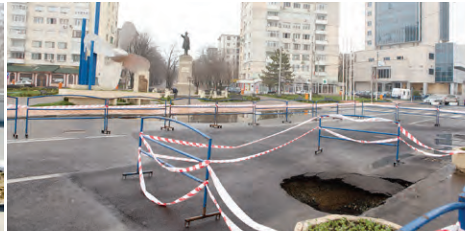
Nemuritoarea groapă de la Elice - aprilie 2013