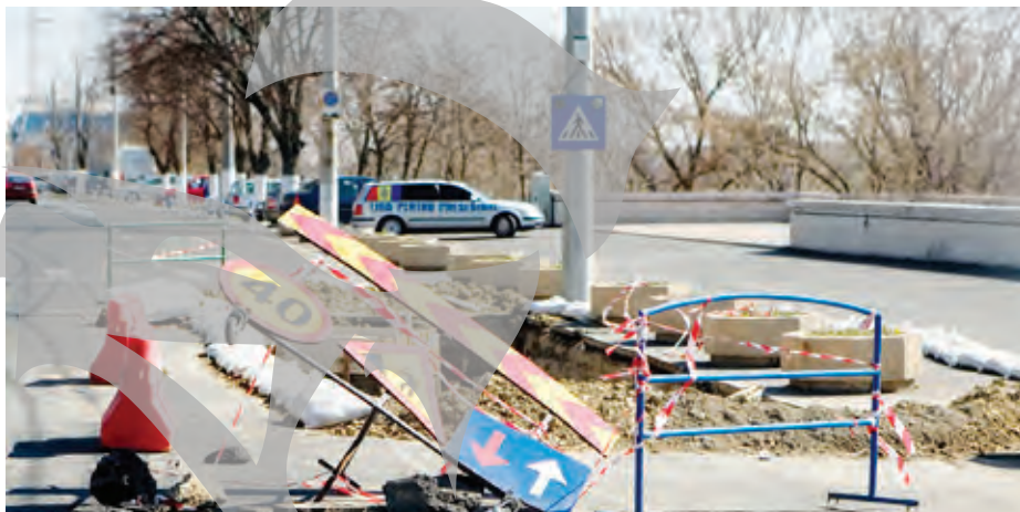
Falezogaura se întoarce - martie 2012