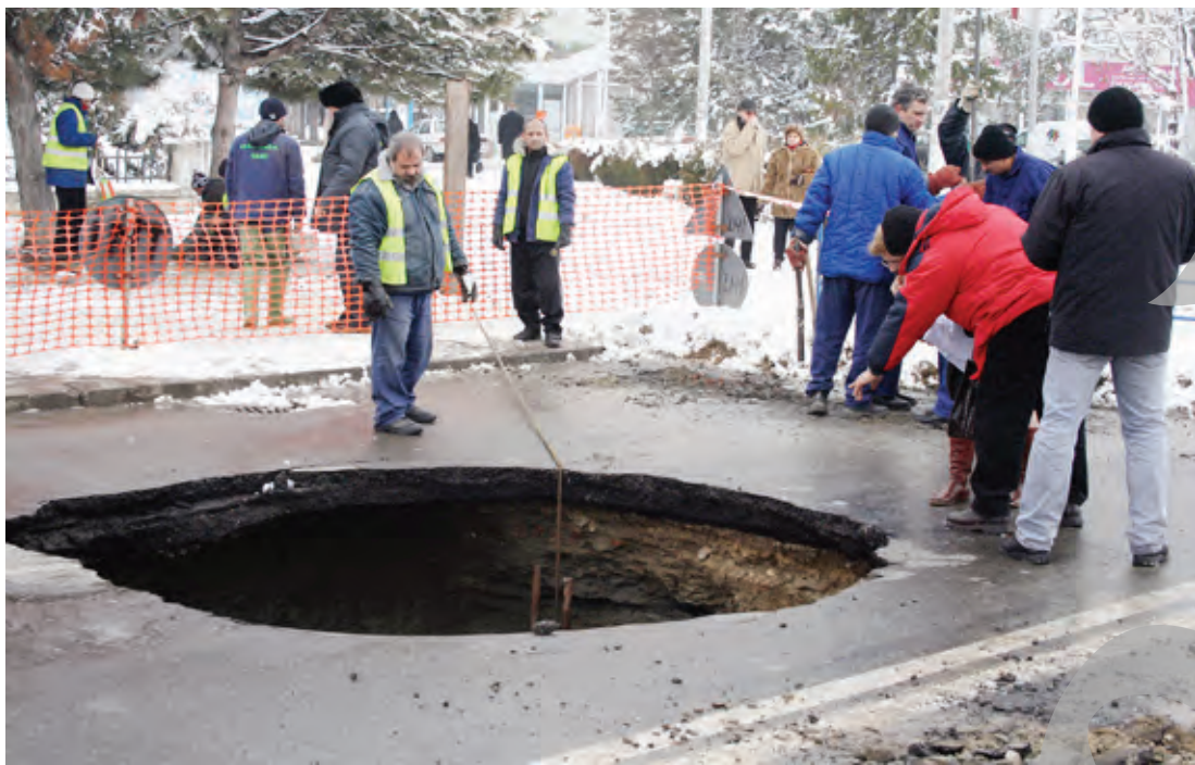
Groapa de la Elice, la "premieră" din februarie 2010

≡ Superficialitatea expertizelor, proiectelor și lucrărilor executate în perioada 2010-2012 depășește sutele de mii de euro cu care autoritățile au încercat să astupe găul de la Elice ≡ „Problema nu o reprezintă gropile pe care le știm, ci acelea care pot să apară oricând”, spune Primăria