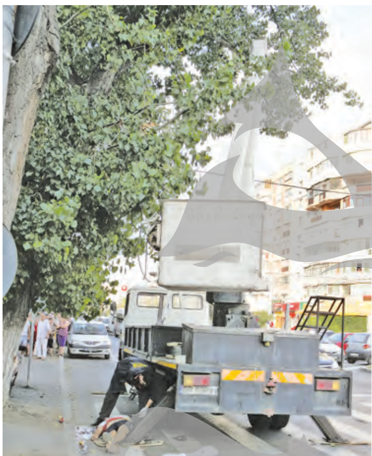
Cele mai riscante joburi în Galați sunt cele din construcții

tor incidente, rămân, în continuare, cele din construcții și metalurgie. „Scăderea numărului accidentelor e dată și de faptul că s-au intensificat controalele pe aplicarea directivelor europene în domeniu. Evenimente sunt