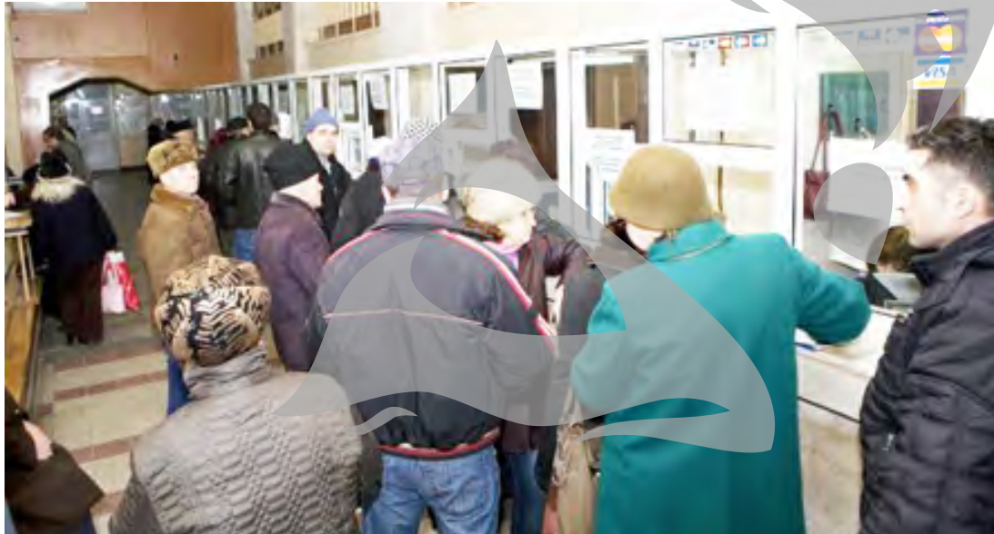
La mâna autorităților

➤ Persoanele fizice, persoanele fizice autorizate, întreprinderile individuale și asociațiile familiale din Galați au două șanse pentru a scăpa de plata majorărilor de întârziere și a penalităților aferente obligațiilor bugetare ➤ O cerere depusă la Direcția de Buget-Finanțe și plata datoriei de bază sunt condițiile pentru a păstra în buzunar banii de penalități și majorări