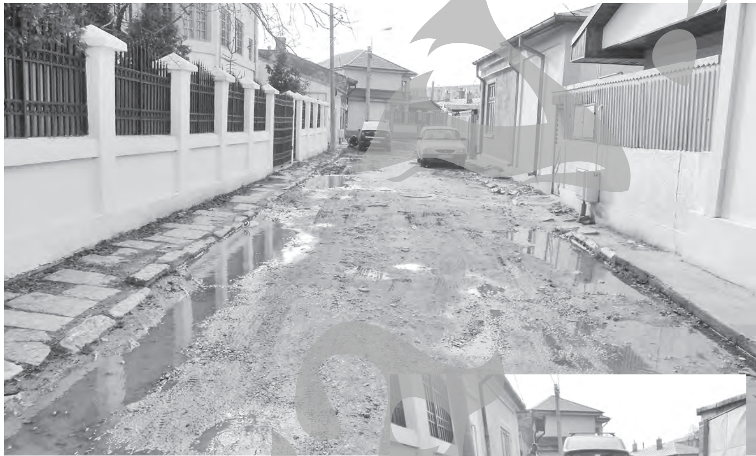
Fundătura Cernei și strada Vămii nici măcar nu există canalizare.

Dacă tot vorbim despre lipsurile străzilor în cauză, poate nu ar fi rău să amintim că unele dintre ele au rețele de apă vechi de peste 100 de ani. Rețeaua de apă de pe Jupiter și Cernei datează din 1908, adică are 105 ani, cea de pe Cantemir are 94 de ani, cea de pe Crișana datează din 1921, cea de pe Izvor din 1925, iar pe