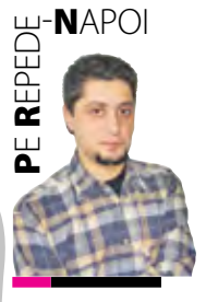
PE REPEDE - NAPOI