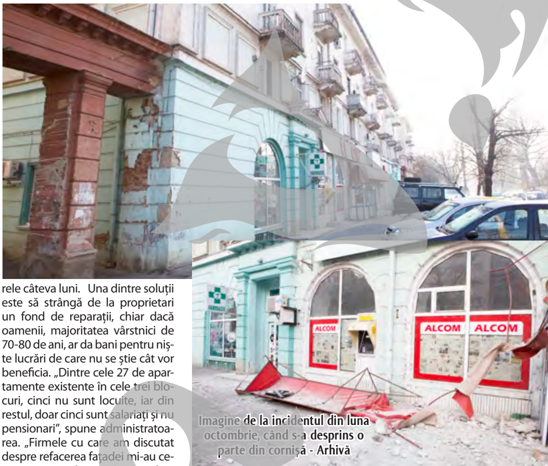
Imagine de la incidentul din luna octombrie, când s-a desprins o parte din cornișă

Administrația se arată îngrijorată de modul cum va rezolva problema, mai ales că după ultimul incident, de la sfârșitul lunii octombrie, după ce o bucată din cornișă a avariat ușor mașina unui student, Primăria i-a somat oficial să ia măsuri. Cert este că problema e departe de rezolvare în următo-