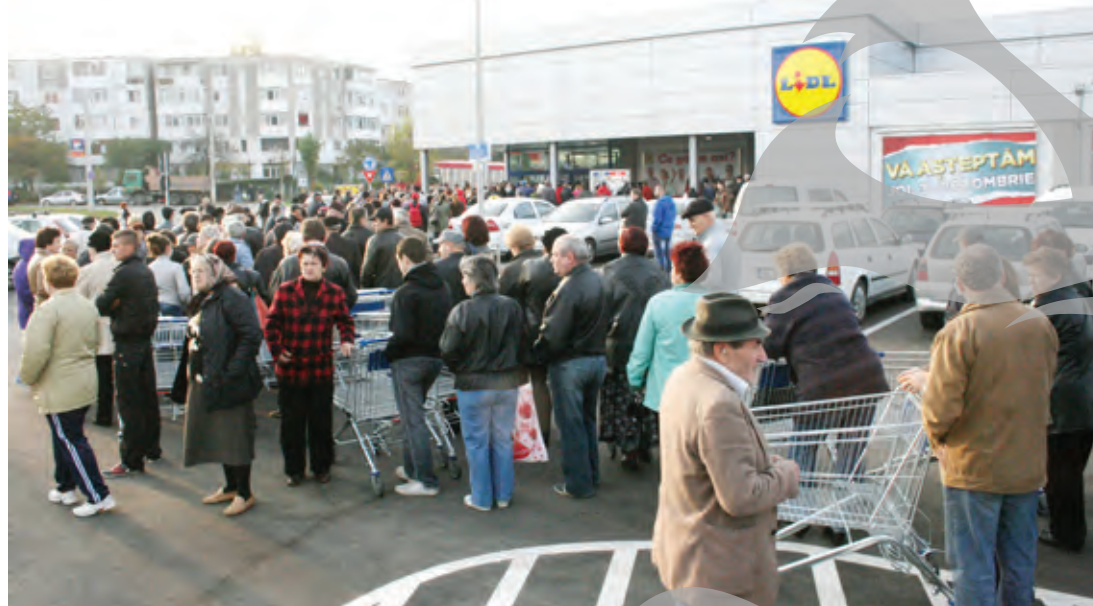
Firma Lidl a fost foarte activă anul acesta la Galați: a deschis două supermarketuri

Unul dintre cele mai importante centre comerciale inaugurate anul acesta este Kaufland. Retailerul german a completat astfel cele două magazine pe care le avea deschise în Micro 19 și în Micro 39.