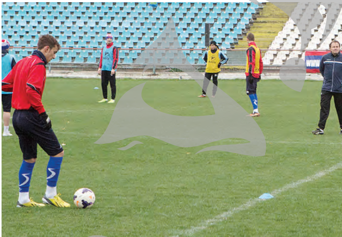
Zece zile în Galați, apoi în Spania

La reunire sunt așteptați și mulți suporterii, care își propun să respecte tradiția și să asigure o atmosferă entuziasmantă la primul antrenament de după vacanță. „A devenit deja o tradiție ca suporterii Oțelului să-și întâmpine favoriții la fiecare reunire a lotului într-un număr mare. Grupul Steel Boys face apel la toți iubitorii Oțelului, să-și demonstreze atașamentul de echipă, așa cum au făcut-o în nenumărate rânduri până acum, și să vină în număr cât mai mare la prima întâlnire cu lotul de jucători din acest an. Echipa are nevoie de aportul nostru și este de datoria noastră să îi fim alături, mai ales acum, când trece prin momente mai grele în clasament. Oțelul are nevoie de noi!”, se spune într-un comunicat emis de grupul Steel Boys.