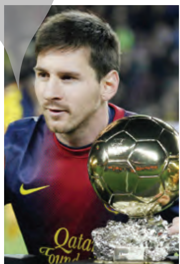
Messi, câștigătorul ultimelor patru ediții

Trofeul Balonul de Aur, pentru care finaliști sunt portughezul Cristiano Ronaldo (Real Madrid), argentinianul Lionel Messi (FC Barcelona) și francezul Franck Ribery (Bayern Munchen), va fi decernat în această seară, în cadrul unei ceremonii ce va avea loc la Zurich. Cristiano Ronaldo, finalist pentru a șasea oară în ultimii șapte ani, consideră că merită să câștige trofeul. „Dacă merit să câștig? Poate că da, la fel ca anul trecut sau în urmă cu doi ani. Cred că merit Balonul de Aur în fiecare an”. Pentru Lionel Messi, un eventual succes luni ar reprezenta al cincilea său trofeu Balonul de Aur consecutiv. „Este o plăcere să mă număr printre finaliști și sunt foarte mândru. În opinia mea trofeele de echipă sunt cele care contează cel mai mult, dar este plăcut să fii apreciat. Și dacă nu voi câștiga