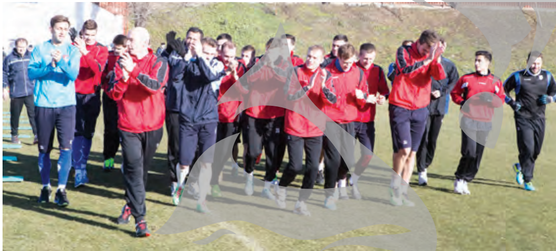
Fotbaliștii Oțelului și-au aplaudat suporterii pentru atmosfera entuziasmantă pe care au creat-o la reunire