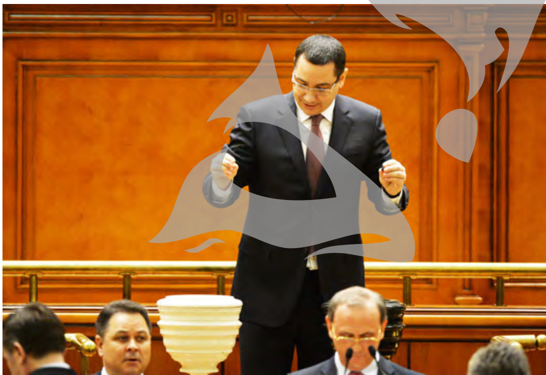
Victor Ponta votând asupra proiectului de hotărâre privind modificarea structurii și a compoziției politice a Guvernului României