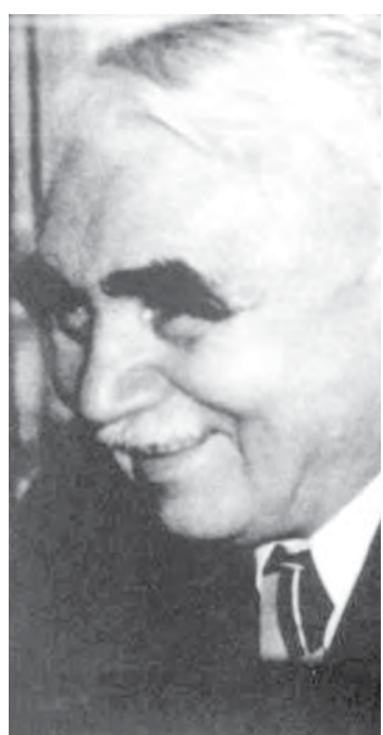
Planului de electrificare a țării. În privința exploatarea și realizarea

continue, a studiat două aspecte majore: 1) ruperea șinelor iarna, din cauza solicitării la tracțiune și flambajului căii și 2) ruperea șinei vara, din cauza solicitării la compresiuni. Probleme principalele a căreia i s-a dedicat a fost sudarea prin presiune cap la cap prin topire intermediară și aplicarea ei pentru șinele de cale ferată. A inventat dispozitivul „Taurus”, de sudat electric șinele, pentru realizarea căilor ferate fără joante. Rezultatele studiilor și experiențelor sale au făcut obiectul a numeroase lucrări de specialitate.