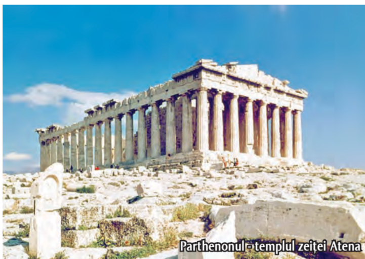
Parthenonul - templul zeiței Atena