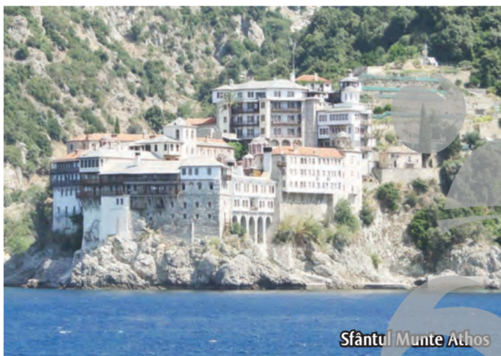
Sfântul Munte Athos