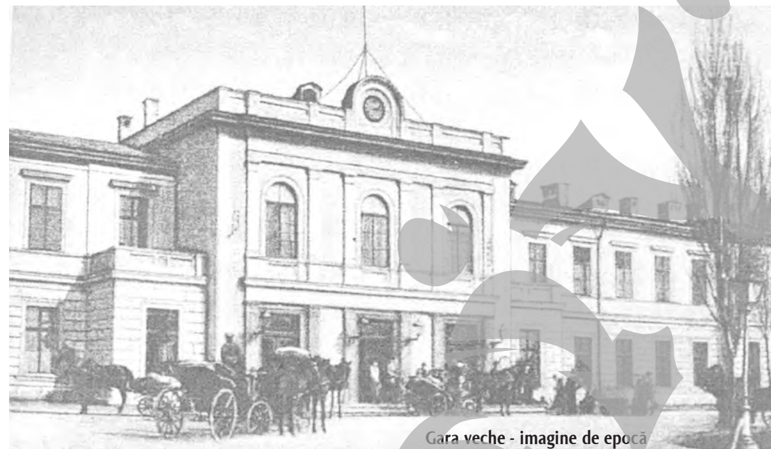
Gara veche - imagine de epocă