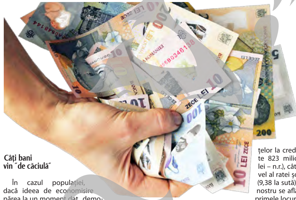
Câți bani vin "de căciulă"

≡ Gălățenii au în conturi peste 800 milioane de euro, dar în plan local nu există nicio strategie de atragere a investițiilor în economie ≡ Astfel, banii rămân în bănci, la dobânzi real negative, cu pierderi și pentru deponenți, și pentru mediul de afaceri ≡ În acest timp, șomajul crește, iar productivitatea firmelor scade