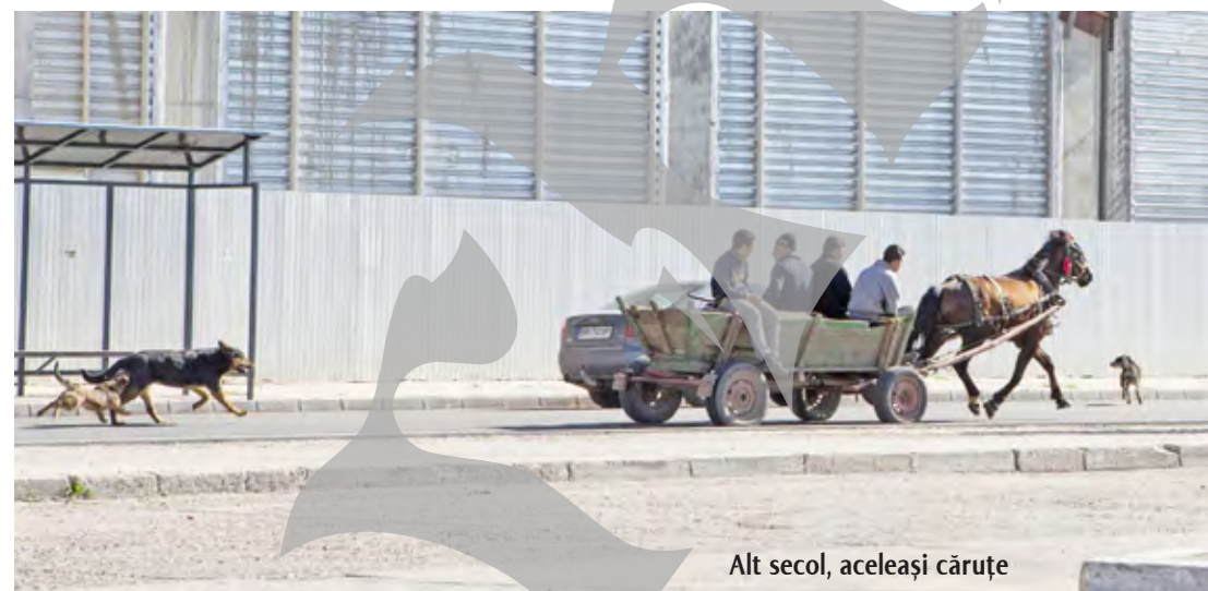
Alt secol, aceleași căruțe