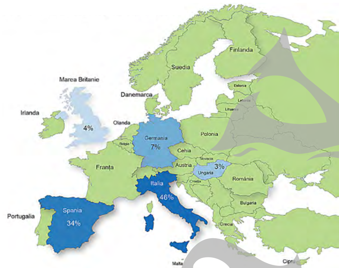
Statele în care au emigrat cei mai mulți români

"Pe parcursul perioadei 1989-2012, populația stabilă a