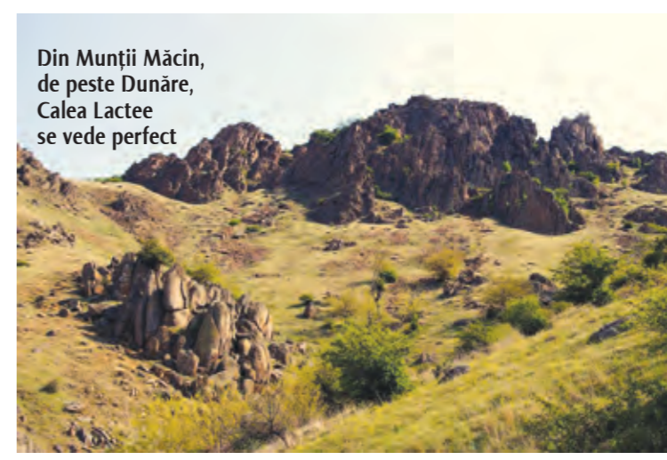
Din Munții Măcin, de peste Dunăre, Calea Lactee se vede perfect

► Parcul Natural Comana, din județul Giurgiu. ► Tot în sudul țării, județele Dolj, Olt sau Teleorman au porțiuni întinse necate destul de întinse. ► Anumite zone din județele Mehedinți și Caraș-Severin. ► La est de Arad, la sud-est de Oradea, la sud de Satu Mare și în preajma orașului Zalău, în sudul județului Constanța, în nordul județului Galați. ► Delta Dunării și Munții Măcin, în județul Tulcea (în Munții Măcin se fac și tabere de astronomie). Zona Munții Măcin - Galați are și avantajul unui număr mai mare de zile senine decât alte zone din țară.