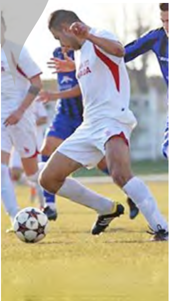
Gloria Buzău cu un categoric 7-0. Marcatorii celor șapte reușite: Vintilă, Matei, Antofe, Comșa,

* În Campionatele Naționale pentru juniori A și B a fost o etapă nefavorabilă echipelor gălățene, care s-au impus în doar două jocuri din cele șase programate în acest weekend. „Rușinea” a fost salvată de juniorii A de la FCM Dunărea, care au învins