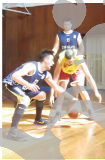
măine până pe 25 mai, la turneul final al Campionatului Național, care va avea loc la Alexandria. Formația galățeană, antrena-

Altfel, echipa Phoenix LPS de junioare Under 16 va evolua, de