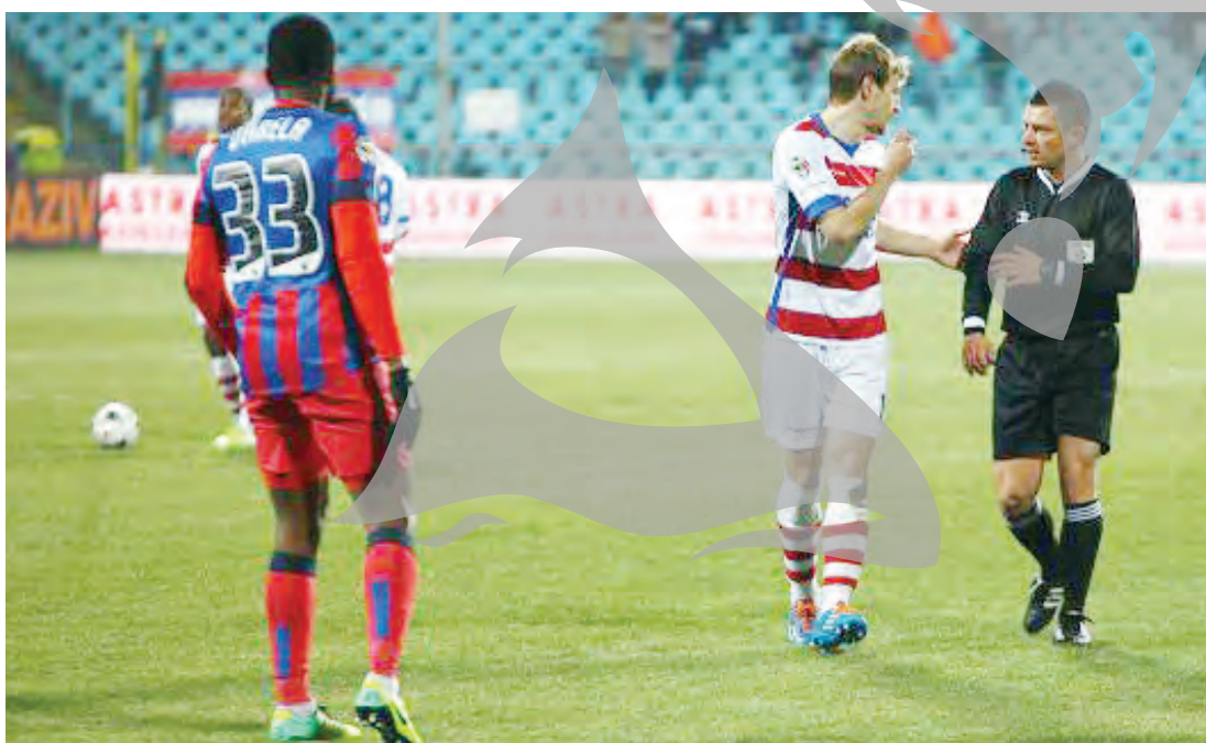
În tur, Steaua a scăpat neînvinșă (scor 1-1) la Galați, ajutată grosolan de arbitrul Iulian Dîma

Stadionul Național Arena. În condițiile în care este posibil ca pentru mulți dintre jucătorii Oțelului acesta să fie ultimul meci în tricoul roș-alb-albastru, este de așteptat o prestație de rămas-bun la înălțimea așteptărilor fanilor, prin care să strice cât de cât sărbătoarea decernării tro-