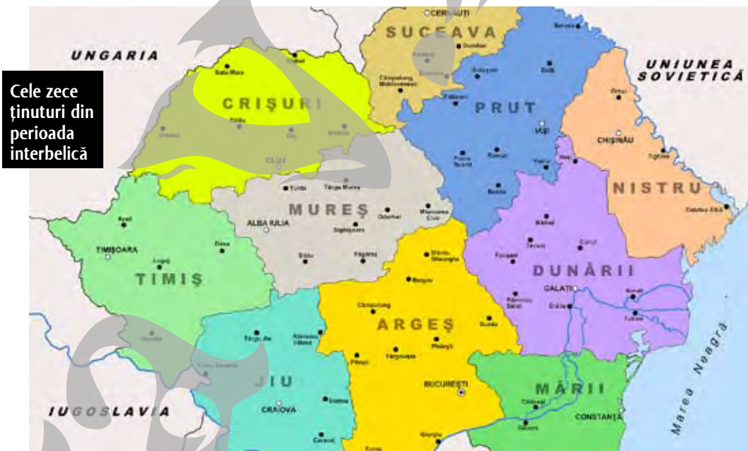
Cele zece ținuturi din perioada interbelică

Material realizat din surse online de Adrian Bot redactie@viata-libera.ro