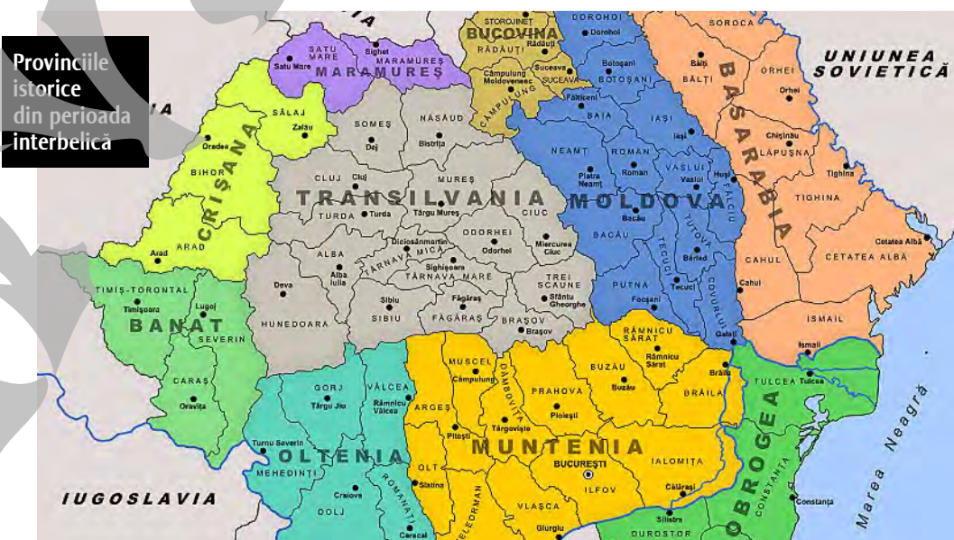
Provinciile istorice din perioada interbelică