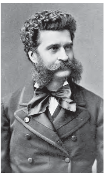
încredințată fraților săi, Joseph (1827-1870) și Eduard (1835-1916), și se consacră compunerii de muzică de divertisment.