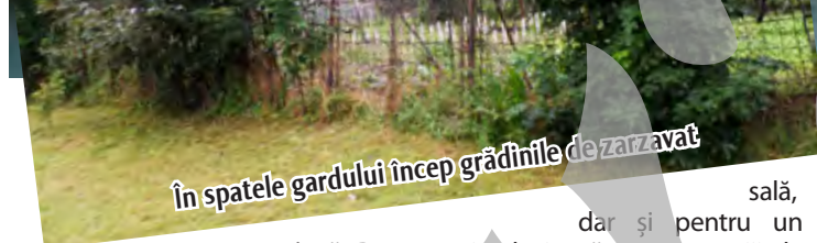
În spatele gardului încep grădinile de zarzavat