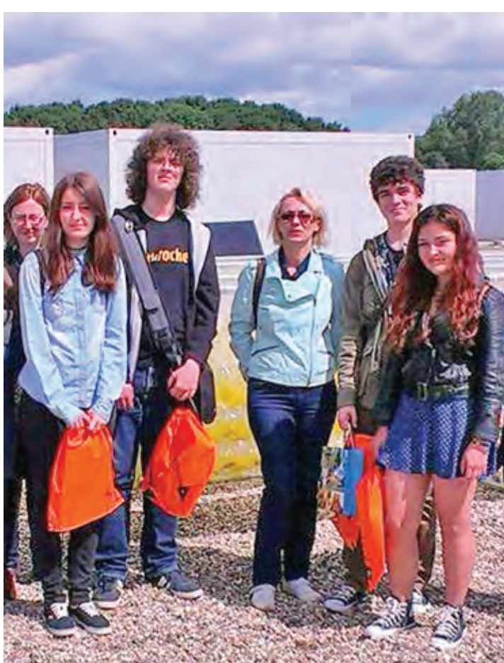
Cei patru elevi de la „Cuza”, în vizită la una dintre firmele olandeze care au sponsorizat concursul

Jurații concursului au fost impresionați și de labirintul în care se pătrunde cu niște ochelari special proiectați și dotați cu diverși senzori. Ochelarii sunt cei care te ajută să te orientezi, pentru că scot anumite sunete atunci când te apropii de pereți și alte când găsești o intrare. Ochelarii pot fi utilizați și de nevăzători datorită senzorilor atașați, permițându-le „să vadă” cu ajutorul sunetelor. Un alt ele-