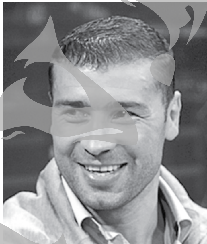
Publicațiilor de Box „antrenorul anului” în 2003, 2006, 2008, 2009, 2010 și 2013.

Freddie Roach are 54 de ani, este un antrenor american și fost boxer profesionist, votat de către Asociația Americană a