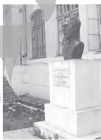
Colegiul Național „Al. I. Cuza” - singurul liceu cu procent maxim de promovare după prima sesiune

O veste bună există totuși: Galațiul nu mai are nicio instituție de învățământ cu procent de promovare zero: la Liceul Tehnologic din Ivești, un candi-