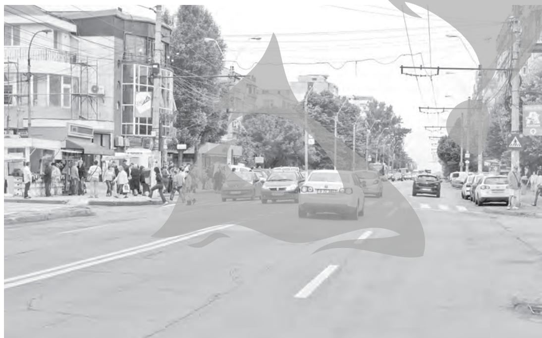
Micro 19, un cartier cenușiu și la propriu, și la figurat

„Au fost două cluburi aici, ambele în mall, dar au fost închise și s-a deschis altceva. Fiind un oraș