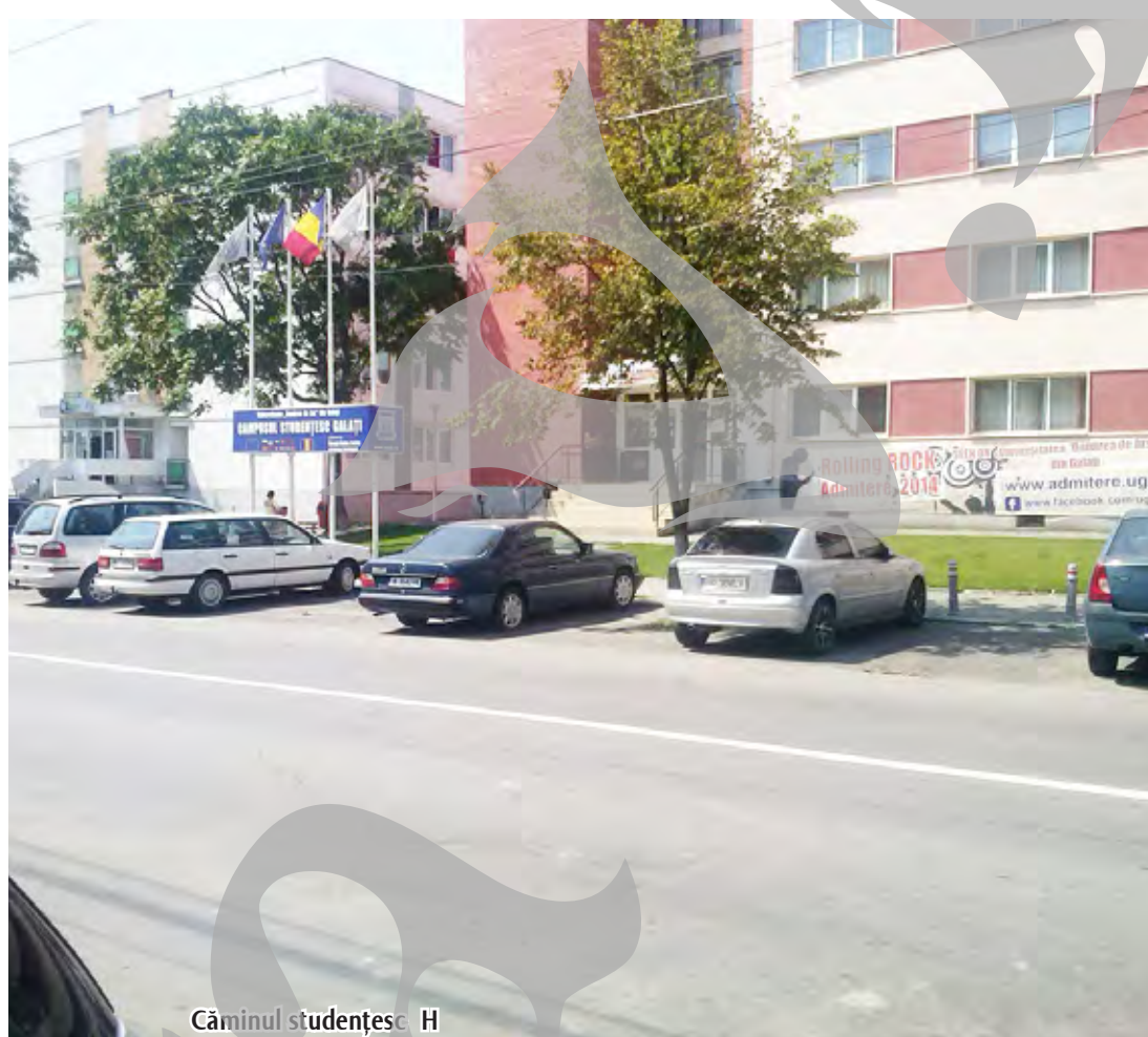
Căminul studențesc H

pe strada Științei. Primul bloc a fost chiar C-ul, construit pentru cei de la Laminorul de tablă „Cristea Nicolae” - INTFOR, azi „Partidul (PCR, n.red.) ne-a dat locuință aici, aveam doi copii...”. Se uită alături; „Iar căminul acesta (A, n.red.), de când a plecat Ceaușescu la cimitir, așa a rămas! N-a rămas decât tabla s-o mai ieie, c-au furat tot-tot! Au furat și schelele din lemn!”