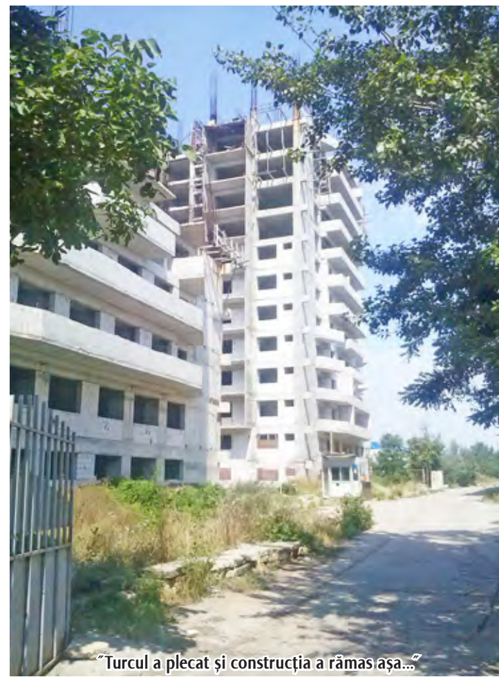
Turcul a plecat și construcția a rămas așa...?

Cealaltă faleză, a Dunării, „nu știe”! Un model pentru salvarea orașului