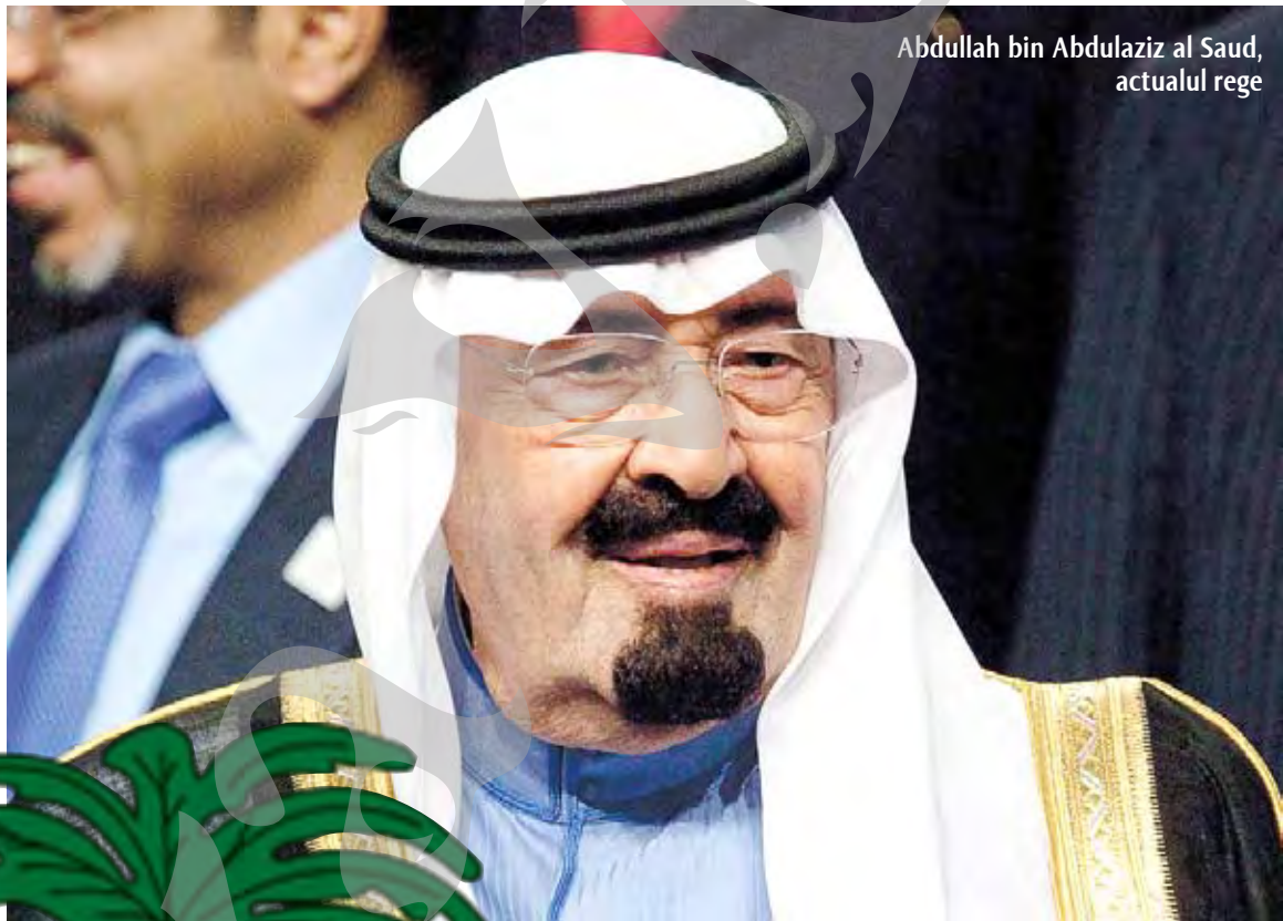
Abdullah bin Abdulaziz al Saud, actualul rege

În 1814, Saud moare, fiind succedat la tron de către fiul său Abdullah, care a trebuit să înfrunte o invazie a trupelor otomane și egiptene. Victoria nu a fost de