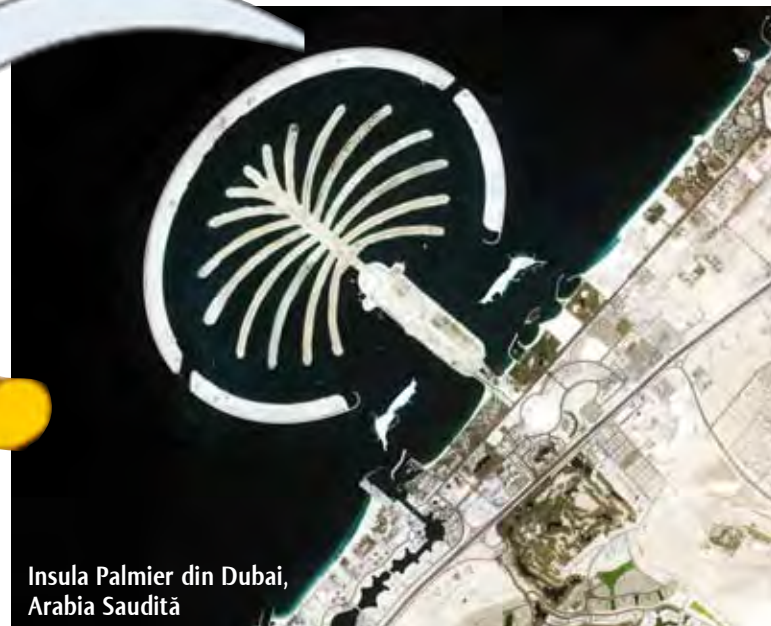
Insula Palmier din Dubai, Arabia Saudită

În 1945, Bin Saud reușește să stabilească o alianță puternică cu Statele Unite ale Americii, iar în 1953 moare. Cu toate acestea, el încă este numit tatăl fondator al națiunii, fiind unul dintre cei mai respectați membri ai dinastiei.