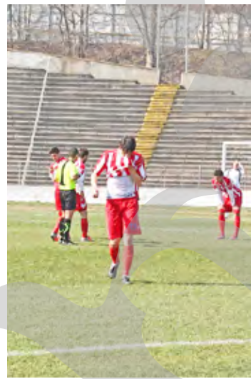
FCM Dunărea s-a asociat cu Clubul Steaua Dunării și sub denumirea de Asociația Sport Club Municipal Dunărea își va continua activitatea doar la nivel de juniori și copii. Inițial s-a dorit ca,