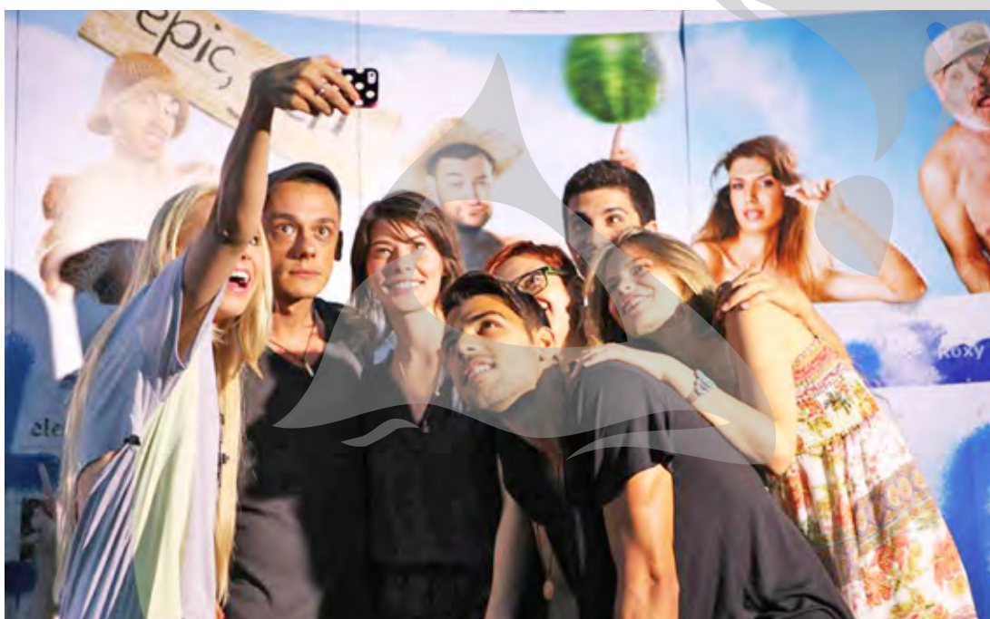
Echipa de actori tineri într-o ședință de... selfie, adică autoportret pe telefon

Dar cuscenariul, amuzant, neașteptat și cursiv, este o întreagă poveste. De fapt... 27 de povești: au