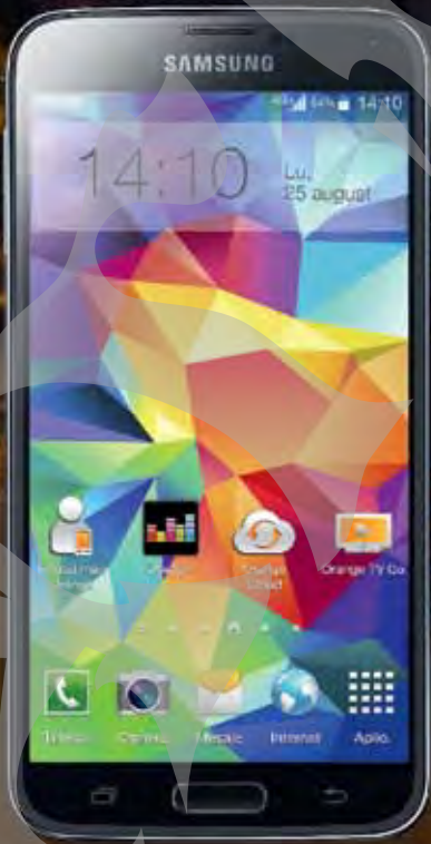
Samsung Galaxy S5 4G+