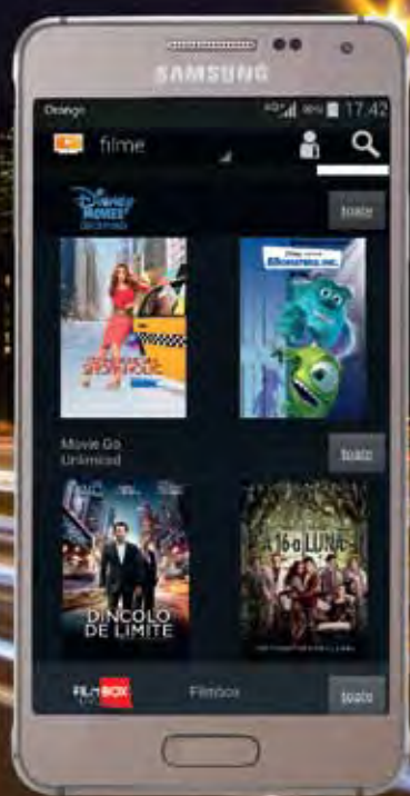
Samsung Galaxy Alpha 4G+