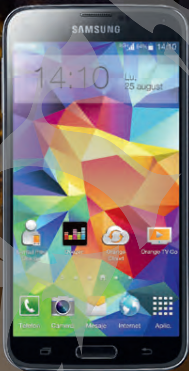
Samsung Galaxy S5 4G+