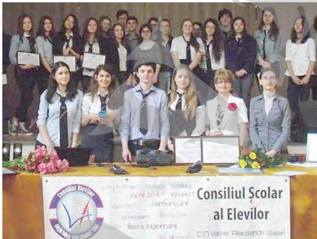
Membrii Consiliului Școlar al Elevilor de la CNVA

În momentul în care s-a introdus o săptămână dedicată educației alternative generic denumită „Școala Altfel”, alte activități au devenit la rândul lor