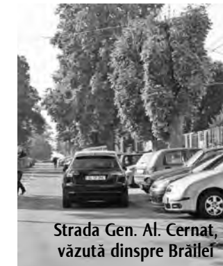
Strada Gen. Al. Cernat, văzută dinspre Brăilei

Profitând de lucrările de reparare a asfaltului de pe prima bandă de pe Brăilei, unii șoferi au găsit nimerit să parcheze chiar în fața la Telefoane. Situația este identică și pe strada Al. Cernat, între clădirea Finanțelor și cea a BCR, acolo unde mașinile parcate flanchează carosabilul pe ambele părți. Și aici, lipsa locurilor de parcare este cea mai mare „durere” a șoferilor.