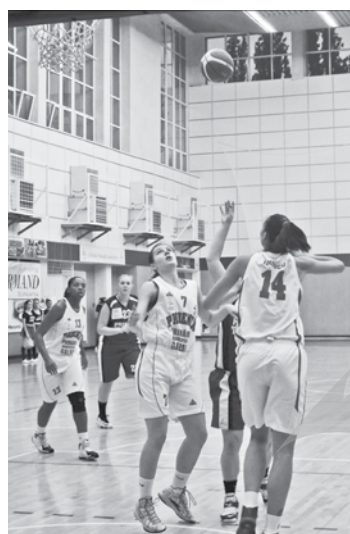
Echipa de baschet feminin Phoenix Galați va juca, astăzi, de la ora 13,00, în deplasare, cu

SCM Craiova, în cadrul etapei a cincea din Liga Națională, ținând la patra victorie consecutivă. Echipa gălățeană pornește ca mare favorită, ținând cont că SCM Craiova este singura formație din campionat fără nicio jucătoare din străinătate în lot și ocupă ultimul loc în clasament, cu înfrângeri în toate partidele precedente. Phoenix se află pe locul șapte, cu 7 puncte, cu mențiunea că ocupantele locurilor 3-7 au câte un singur eșec și se diferențiază doar prin coșaveraj, în timp ce primele două din clasament, CSU Alba Iulia și ICIM Arad, au tot câte o înfrângere, dar ambele cu un joc în plus.