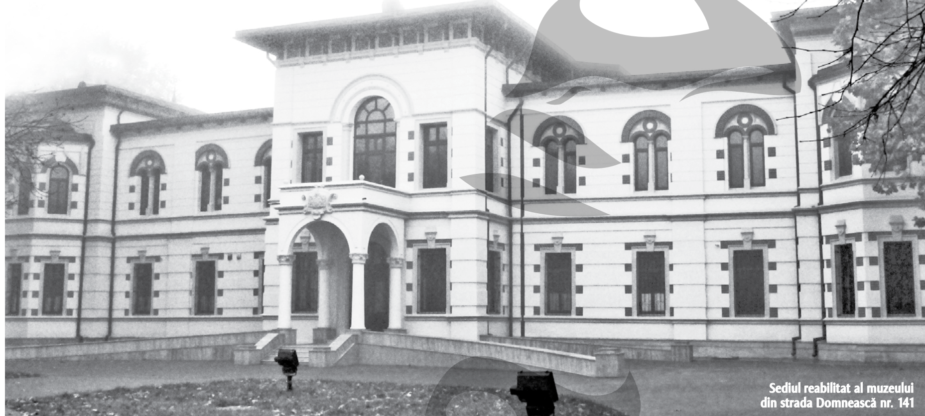
Sediul reabilitat al muzeului din strada Domnească nr. 141

≡ Lăcașul de cultură, în care sunt oferite publicului aproape 400 de exponate, comori de patrimoniu și spiritualitate ortodoxă, își va deschide porțile cu prilejul Sărbătorilor Sf. Ap. Andrei