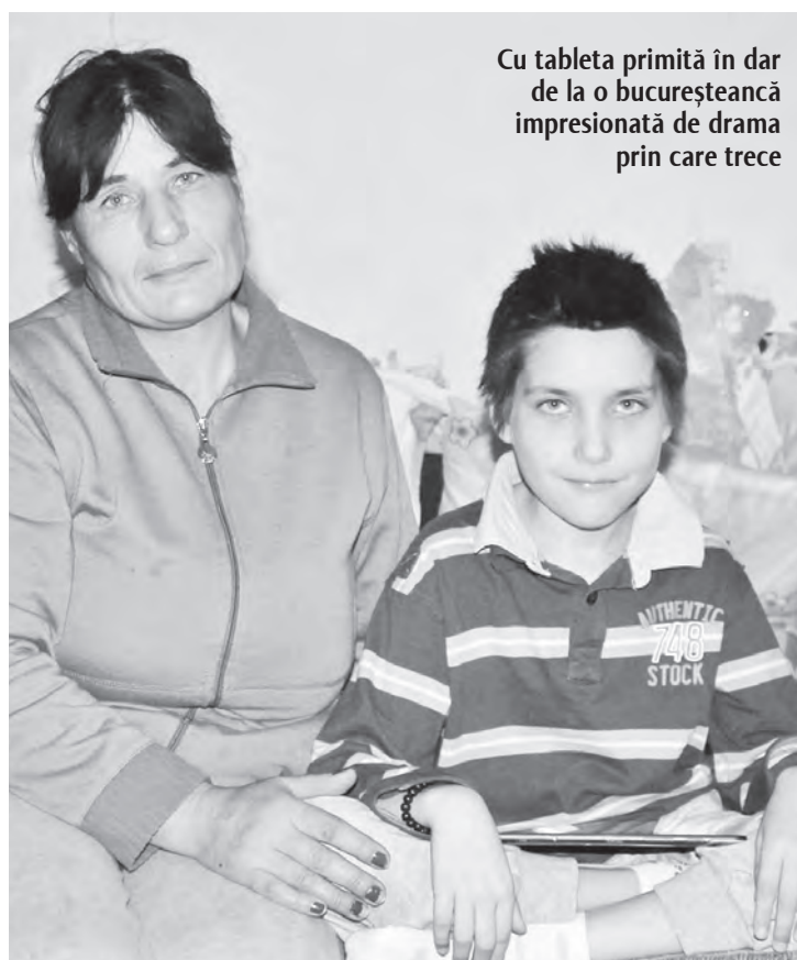
Cu tableta primită în dar de la o bucușteancă impresionată de drama prin care trece

Glicemia presupune prelevarea unei cantități minuscule de sânge din bucurul degetului. Rezultatul este afișat de aparat în doar câteva secunde. Testul nu este dureros și nu are efecte secundare.