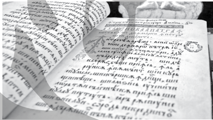
Cazania lui Varlaam

Cultură, artă, etnografie. Secțiunea este dedicată artei care s-a născut în biserică, dar și învățământului bisericesc și interacțiunii dintre cultura ortodoxă și cea laică. Găsim aici o is-