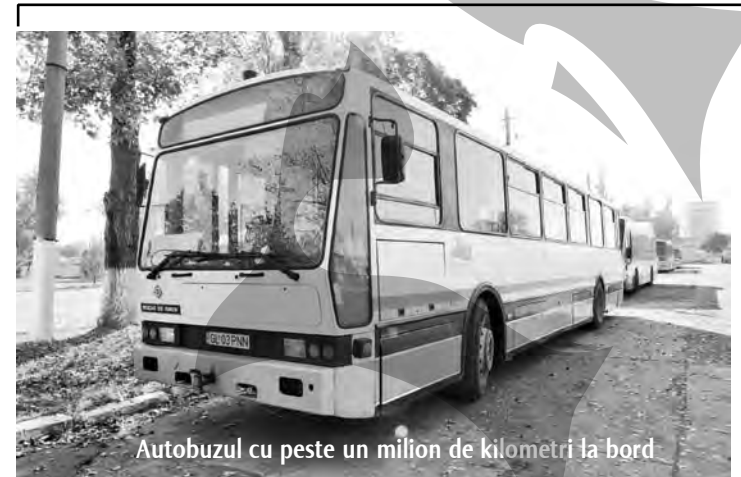
Autobuzul cu peste un milion de kilometri la bord

Dacă cineva ar avea ideea de a înființa la Galați un muzeu al transportului public, goana după exponate nu ar fi deloc o bătaie prea mare de cap. Și asta pentru că multe dintre mașinile aflate acum în curtea Autobazei Transurb ar putea deveni fără probleme piese de muzeu.