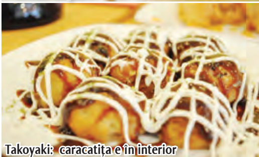
Takoyaki: caracatița e în interior