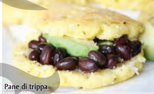
Pane di trippa