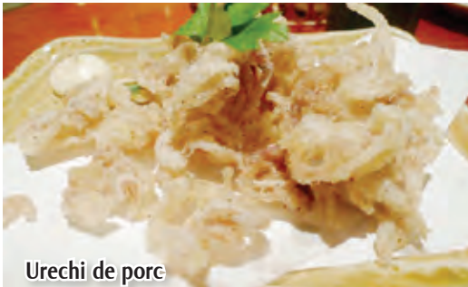
Urechi de porc