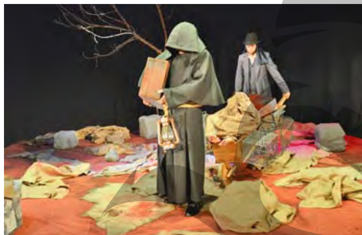
Scenă din „Banda lui Moebius”