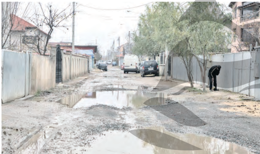
“Când plouă, strada devine piscină”

Fiecare notă de plată pentru chemarea vidanjiștilor ajunge până la 170 de lei, iar în condițiile în care acest lucru se repetă la fiecare două luni, oamenii ajung să cheltuiască peste 1.000 de lei pe an, doar pentru eliminarea dejecțiilor din curte. „Pentru că nu avem canalizare, am fost nevoit să sap gropi în curte, ca să am o toaletă. Parcă trăim la sat, dar și acolo sunt condiții mai bune acum”, ne-a mai spus Lucia Popescu.