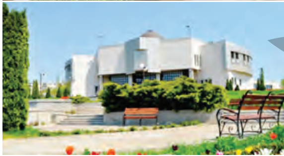
Bilete la Muzeul de Istorie

Și în anul 2015, taxa de vizitare a Muzeului de Istorie pentru copii, elevi și studenți este de doar un leu, iar cea pentru adulți este de patru lei, așa că iubitorii de istorie nu vor face eforturi prea mari pentru a călca pragul instituției. Dacă doriți însă să faceți fotografii și să filmați, să știți că veți fi obligați să plătiți o taxă de cinci, respectiv, 10 lei. Pentru închirierea unei săli cu activitate de publicitate, conferințe, mese rotunde și alte manifestări socio-culturale veți achita 50 de lei pe oră, în timp ce pentru expertiză și consultanță științifică de specialitate va trebui să plătiți 20 de lei pe oră. Taxa pentru eli-