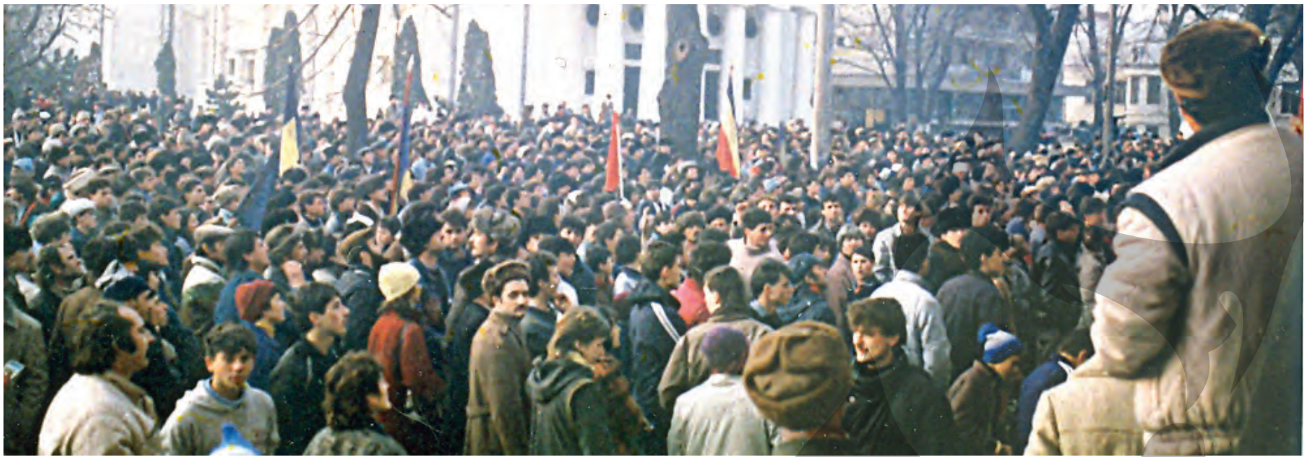
Un sfert de veac din Decembrie '89