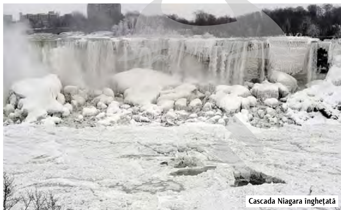
Cascada Niagara înghețată

- Am fost recrutat de o companie franceză, în primăvara lui 2008. Aveam ceva experiență, dobândită la Icepronav, așa că mi s-a propus postul de layout designer, în cadrul unui birou de studiu ce se ocupa cu proiectarea la nivel „basic design” a unei centrale nucleare-electrice tip EPR. După cinci ani am schimbat locul de muncă și, în prezent, sunt inginer mecanic la o altă companie multinațională, ce are ca activitate atât tratarea apelor uzate, cât și proiectarea de instalații de extracție și tratare a pro-