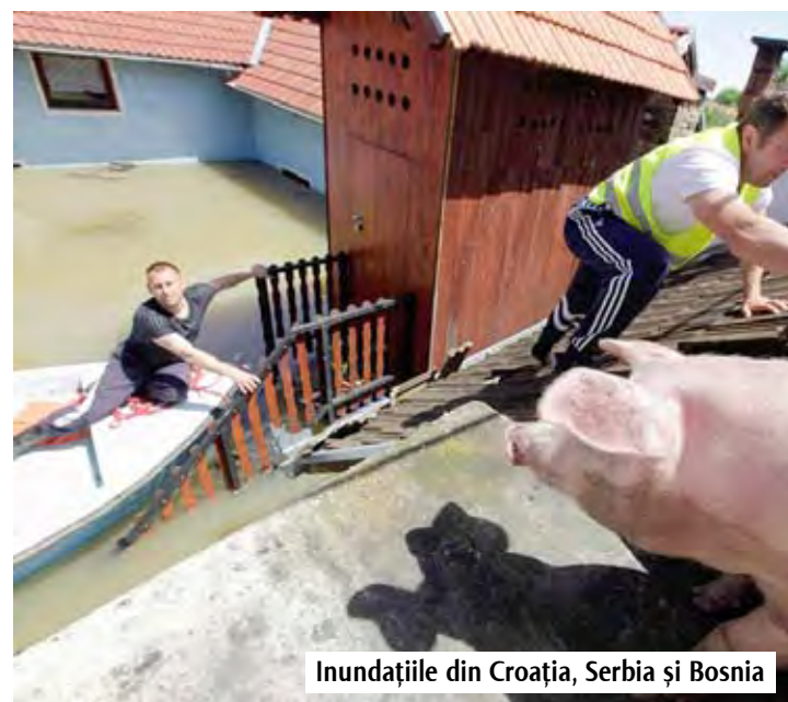
Inundațiile din Croația, Serbia și Bosnia