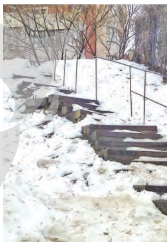
Oricum, la vremea rea, ocolii scările cele mici! Text și foto: Victor Cilincă

Zone ale nimănui! Nu te aștepti să curețe cineva zăpada și de pe scările mici care fac legătura între cele două faleze, în timp ce în oraș, prin zone circulare, autoritățile n-au de-gajat trotoarele sau nu i-au amendat pe proprietarii care ar trebui să-și facă parte... Observăm însă că sunt oameni care riscă să-și rupă picioarele pe treptele burdușite de zăpadă și gheață. Ce-i drept, dacă ocolesc, pot folosi scările de marmură, care sunt curățate. Dar și aici, când urci de pe Faleză Superioară, nu sunt părții și cărarea făcută de pașii trecătorilor „sare”, periculos, peste un șanț de scurgere.