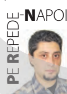
PE REPEDE - NAPOLI