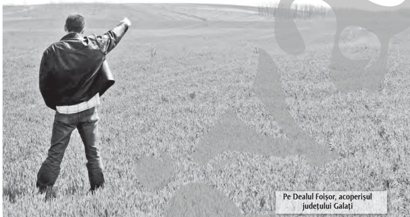
Pe Dealul Foișor, acoperișul județului Galați