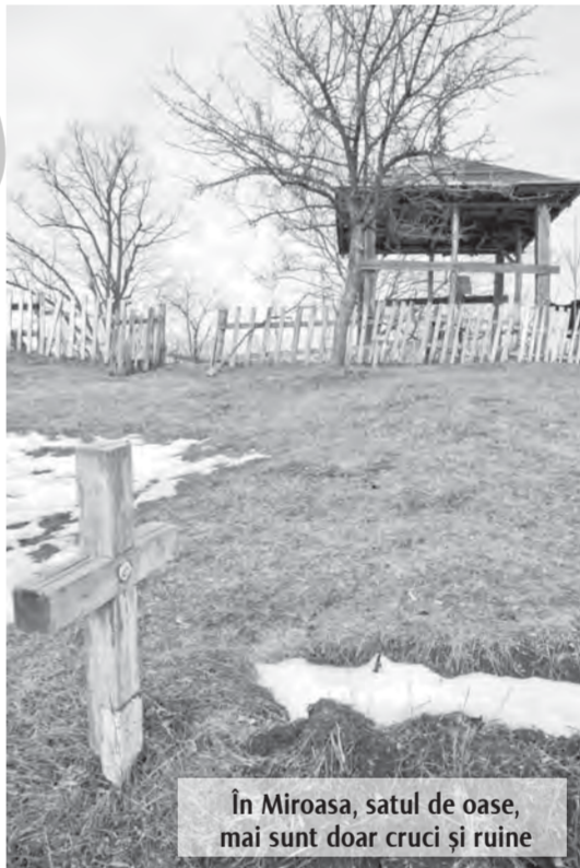
În Miroasa, satul de oase, mai sunt doar cruci și ruine