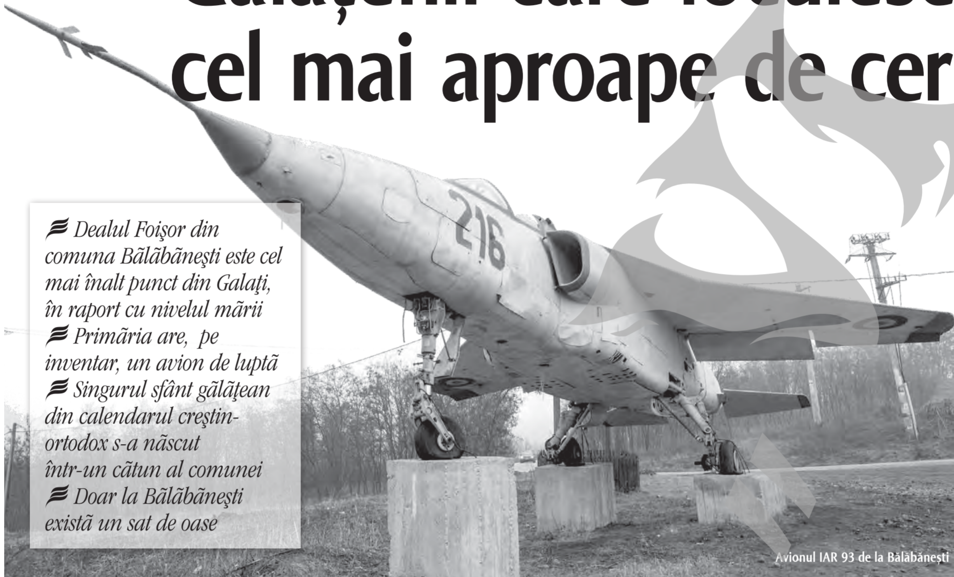
Avionul IAR 93 de la Bălăbănești

Dealul Foișor din comuna Bălăbănești este cel mai înalt punct din Galați, în raport cu nivelul mării Primăria are, pe inventar, un avion de luptă Singurul sfânt gălățean din calendarul creștin-ortodox s-a născut într-un cătun al comunei Doar la Bălăbănești există un sat de oase