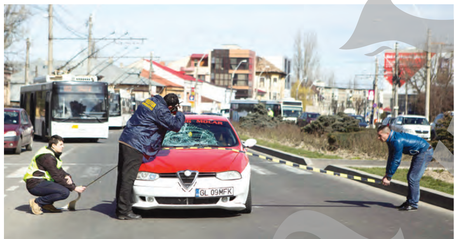
Imagine de la un accident pe trecerea de pietoni de la fostul Stîrc

➤ Pietonii sunt cei mai vinovați în cazul producerii evenimentelor rutiere grave ➤ Municipiul Galați are cinci artere în topul celor mai însângerate străzi ➤ Pe drumul de Tecuci se petrec cele mai multe orori în trafic