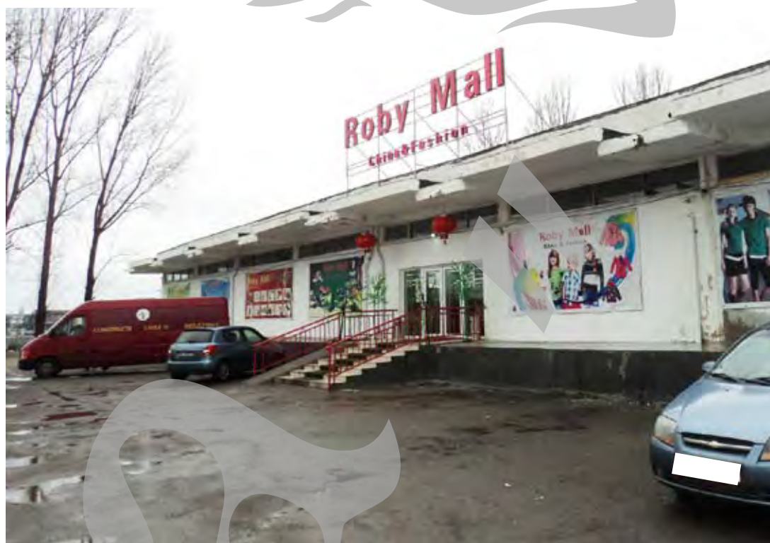
➤ Ce firme controlează magazinele chinezești și câți bani fac

Gălățenii săraci nu-și permit să cumpere mult, nici măcar atunci când vine vorba despre lucruri ieftine. Totuși, o bună parte dintre clienții revin constant ca să-și cumpere chinezărie diverse, așa că unii ajung să lase mii de lei la teigheaua magazinelor, pe durata unui an. Pentru aceste sume primesc bon, dar numai dacă îl cer. Am testat, săptămâna trecută, serviciile a trei magazine deținute de chinezi: Magazinul Universal Perfect din Piața Centrală, China Elegance din Micro 21 și Roby Mall din Micro 39. Dintre toți, doar chinezii din Micro 21 ne-au dat bon fără să-l cerem noi, în mod expres. Și cum mulți gălățeni nu cer, nu-i exclus ca vânzările să fie chiar mai consistente decât ce aflăm noi, de la Finanțe. În medie, judecând după cifrele oficiale de venit, firmele chinezilor lucrează cu puțini angajați – șase sau șapte, cel mult – dar încasează și zeci de mii de lei lunar.