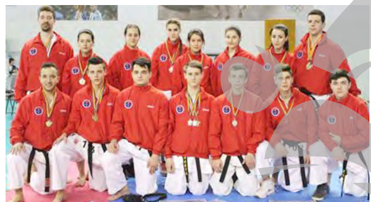
Karateka de la CS Kodo Galați

Campionatul Național de Karate Tradițional - Fudokan pentru cadeți, juniori, tineret și seniori a reunit la Centrul Olimpic de la Izvorani în jur de 200 de sportivi, de la 32 de cluburi. Printre aceștia s-au numărat și 22 de karateka de la două cluburi gălățene de profil, CS Kodo și Karate Club.