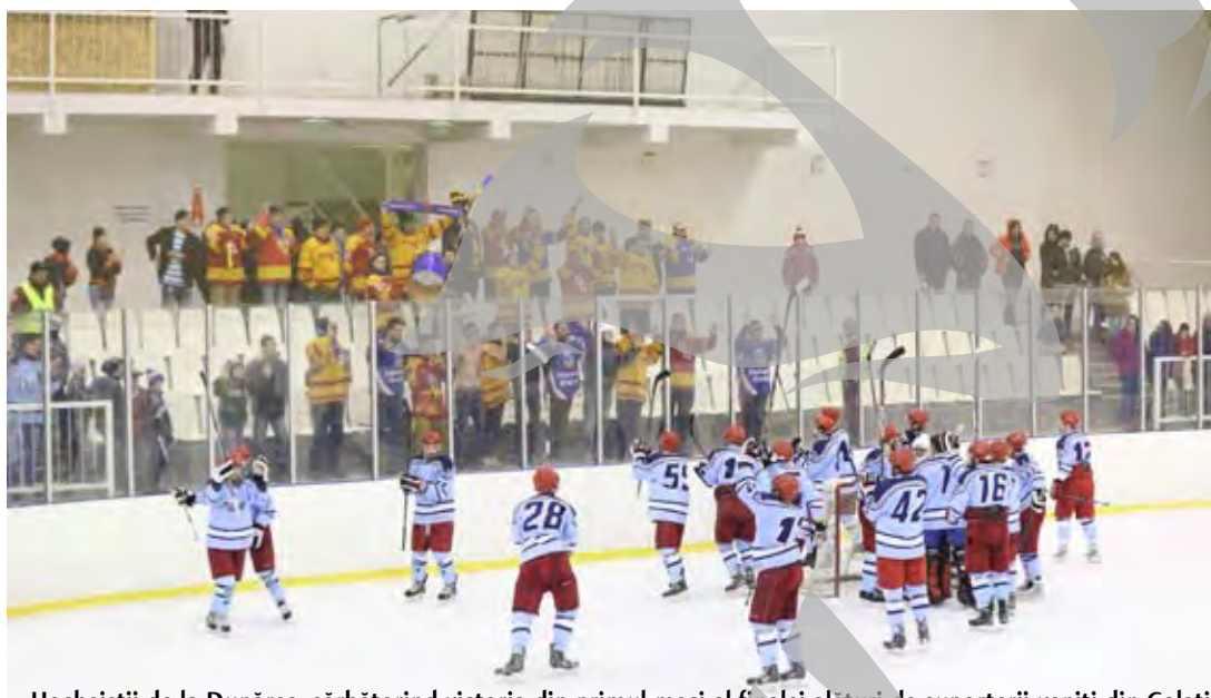
Hocheiștii de la Dunărea, sărbătorind victoria din primul meci al finalei alături de suporterii veniți din Galați

Al doilea meci, jucat sâmbătă seară, a avut un start care a dus moralul celor de la Dunărea la