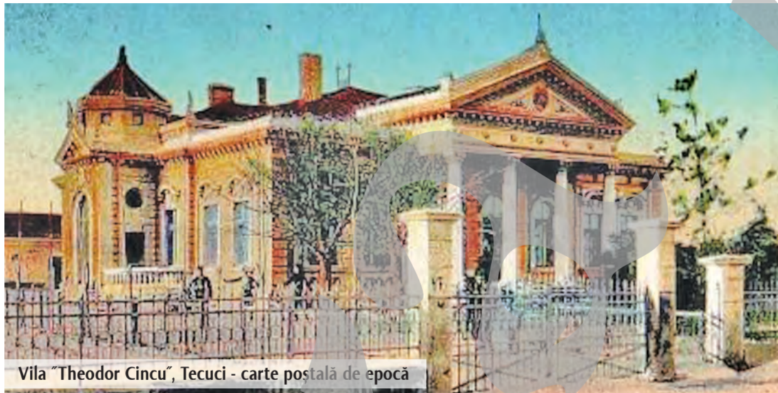
Vila "Theodor Cincu", Tecuci - carte poștală de epocă