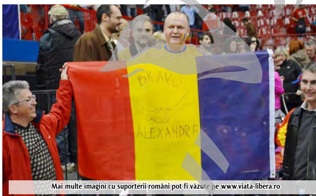
Mai multe imagini cu suporterii români pot fi văzute pe www.viata-libera.ro