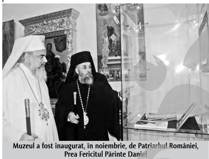
Muzeul a fost inaugurat, în noiembrie, de Patriarhul României, Prea Fericitul Părinte Daniel

Sâmbătă, la ora 18,00, Muzeul Istoriei, Culturii și Spiritualității Creștine de la Dunărea de Jos, amenajat în incinta Palatului