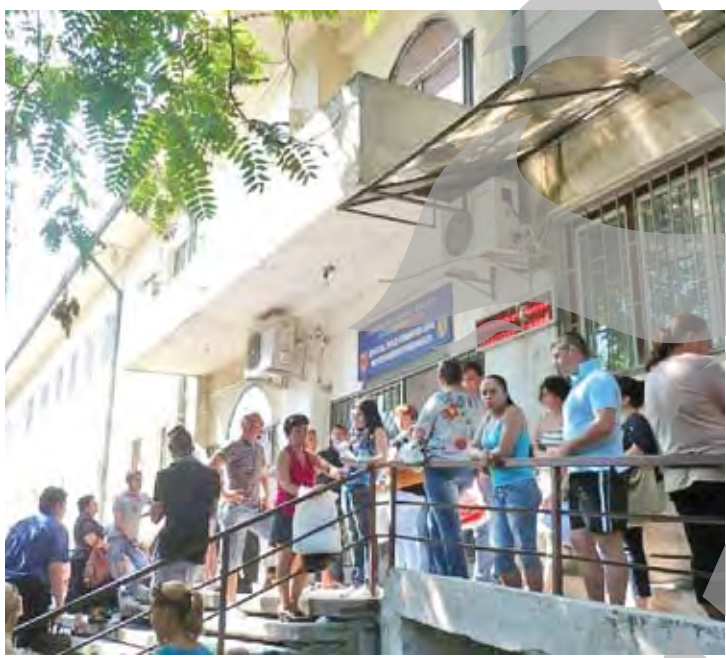
La Muzeul de Științele Naturii

Pentru a fi evitate cozile interminabile care se formează an de an în luna august, la Serviciul Local de Evidența Populației Galați, lună în care vin și gălățenii de peste hotare să-și schimbe buletinele, Primăria Galați recomandă ca persoanele care au documentele de identitate în ultimele trei luni de valabilitate să le schimbe înainte de expirare. „Potrivit legii, schimbarea cărții de identitate se poate solicita și cu trei luni înainte de expirarea valabilității administrative a documentului”, arată un comunicat al Primăriei Galați. În acest sens, municipalitatea recomandă părinților care au copii care împlinesc vârsta legală pentru prima carte de identitate să nu depășească data la care aceștia împlinesc efectiv vârsta