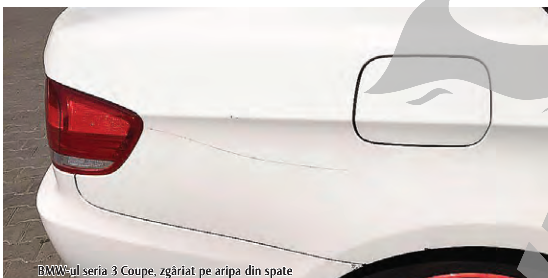
BMW-ul seria 3 Coupe, zgâriat pe aripa din spate

„Bărbatul a fost dus la secție, unde s-a întocmit dosar penal