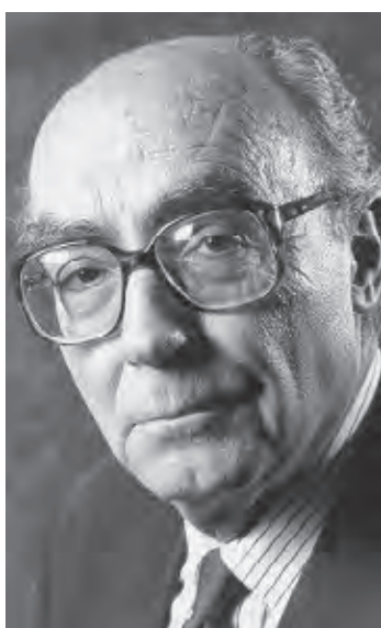
tră”, „Istoria asediului Lisabonei”, romanul „Evanghelia după Iisus Hristos” [criticată îndelung de

S criitorul portughez Jose Saramago s-a născut (pe 16 noiembrie 1922) în localitatea Azinhaga, iar doi ani mai târziu, familia s-a mutat la Lisabona. Cea mai mare dorință a sa a fost să devină scriitor și, la vârsta de 25 de ani a publicat primul său roman, „Terra do Pecado”. După o lungă pauză, de aproape 20 de ani, în care nu a publicat nimic, pentru că, după cum afirma, „nu avea nimic de spus”, s-a dedicat (în perioada 1955-1975) poeziei. În anul 1977, a publicat romanul „Manual de pictură și caligrafie”, urmat de o carte de povestiri și o operă teatrală. Faima mondială i-a adus-o, în 1982, romanul „Memorialul mânăstirii” și i-a reconfirmat-o, doi ani mai târziu, publicarea romanului „Anul morții lui Ricardo Reins”. Au urmat: „Pluta de pia-